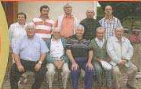
Les 30 ans du comité des fêtes